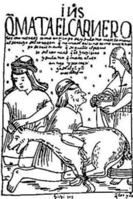
3. Escena de sacrificio de animales.