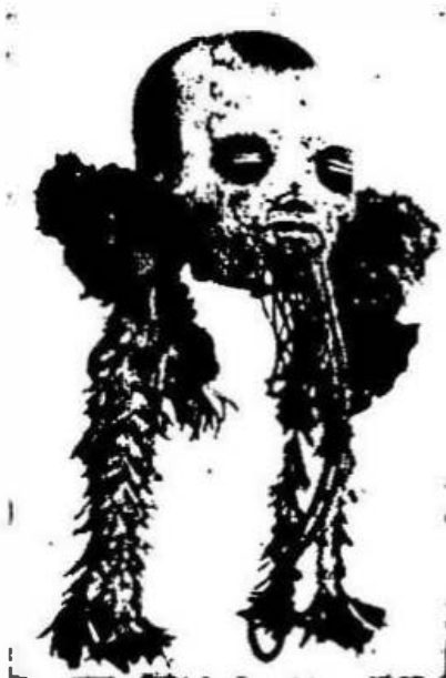
4. Cabeza humana momificada.