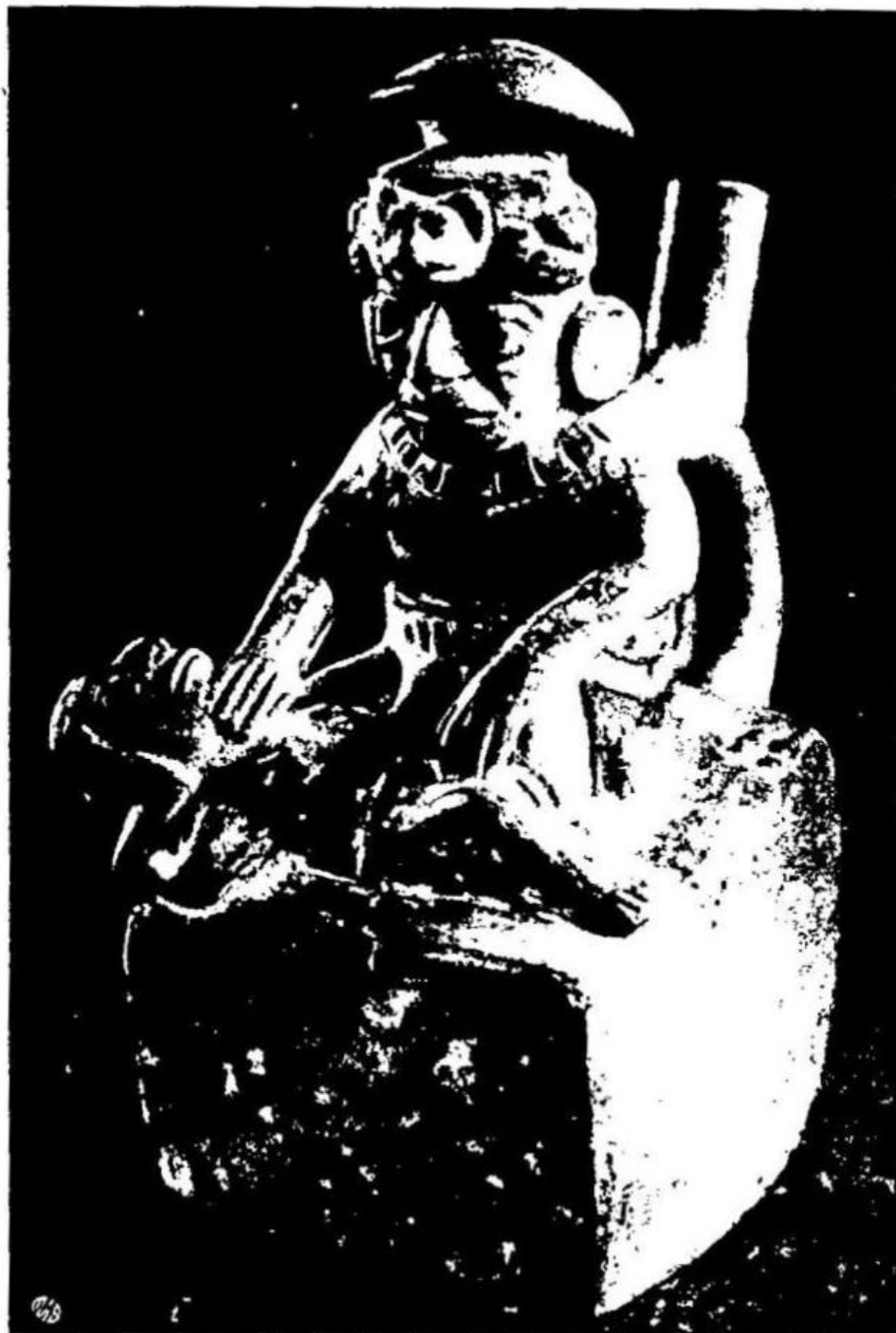
El mago o hampi camayoc practicando un examen y una cura mágica.