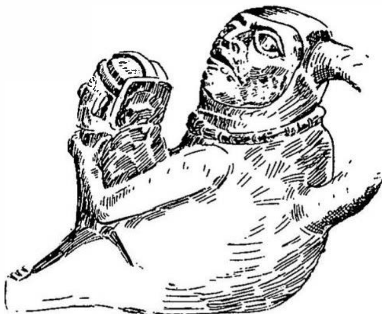
1. El chuco, según R. Carrión Cachot.