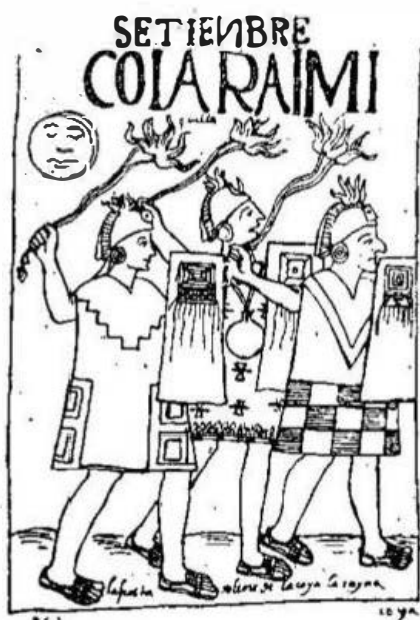
1. La fiesta de Coya Raimi.