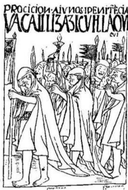
2. Procesiones y ayunos.