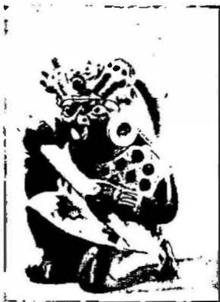
1. Narigueras y orejeras.