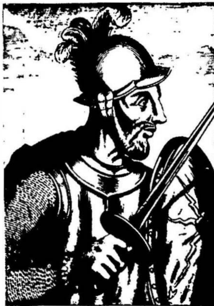
2. Diego de Almagro, el Viejo .