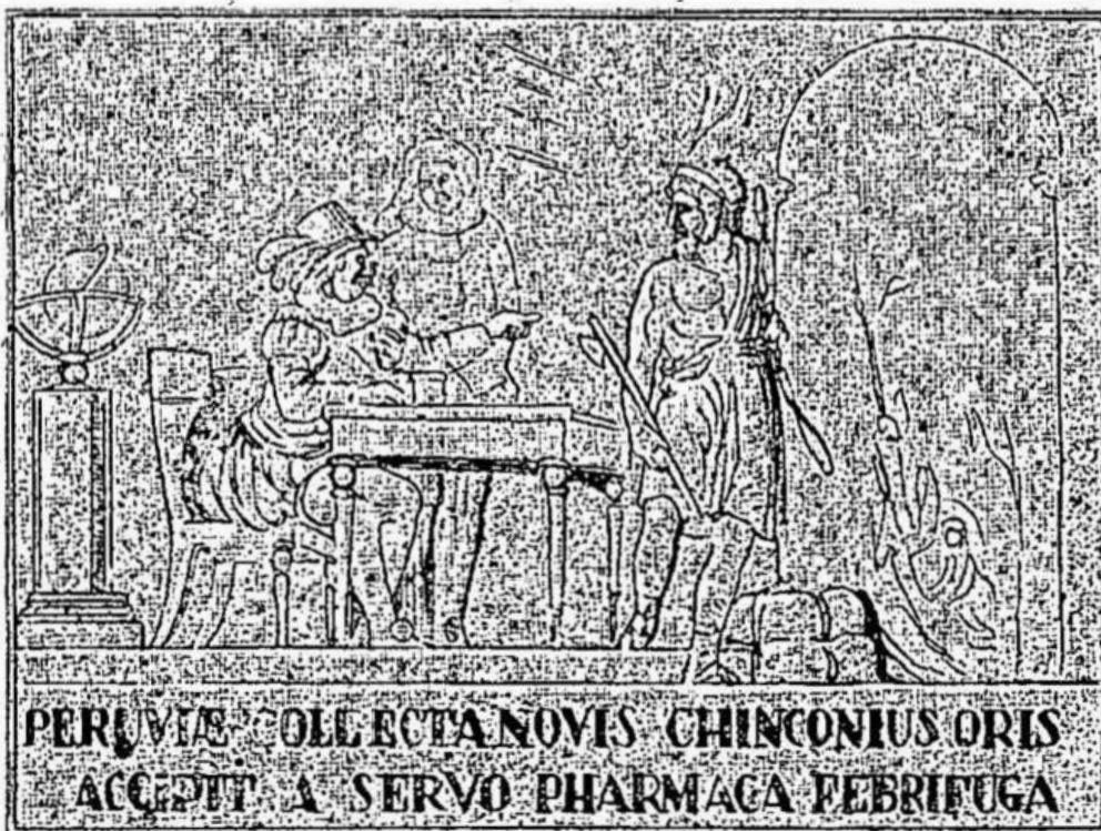
2. Indígenas informando al Corregidor de Loja de las virtudes de la quina.