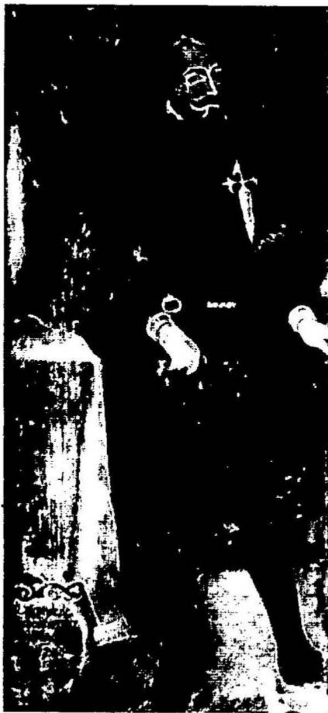
El Conde de Chinchón, Virrey del Perú.