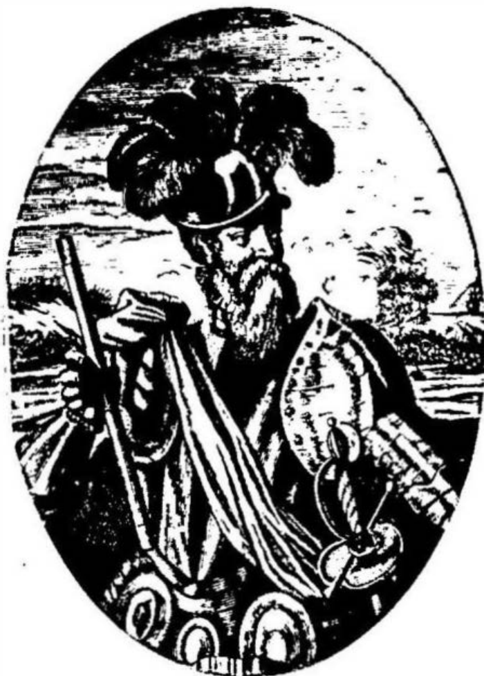
1. Francisco Pizarro.