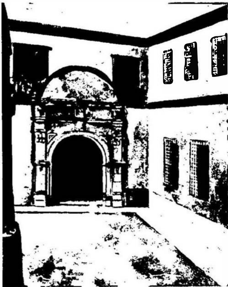
1. El primer hospital de Lima, en la rinconada de Santo Domingo.