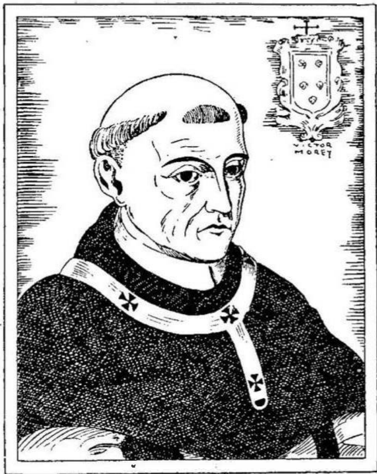
1. El Arzobispo Fray Jerónimo de Loayza.