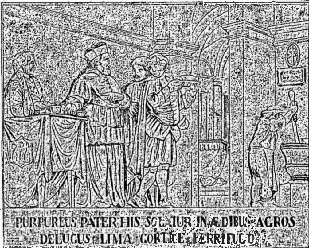
1. El Cardenal Lugo ordena la administración de la quina en Roma.