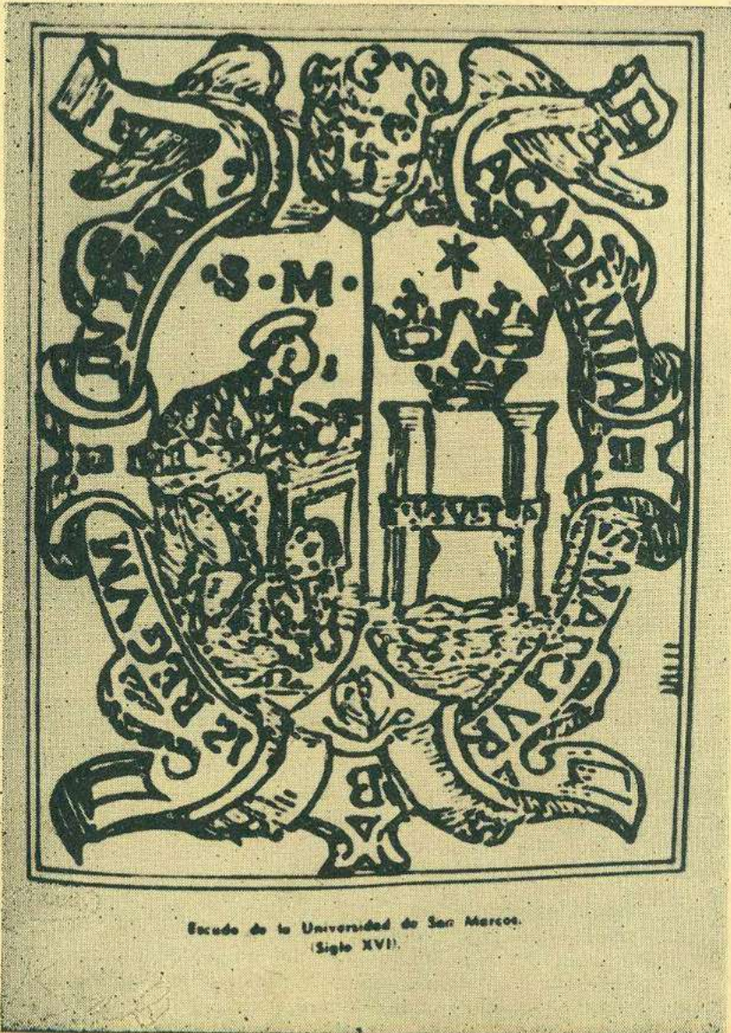
Escudo de la Universidad de San Marcos. (Siglo XVI).