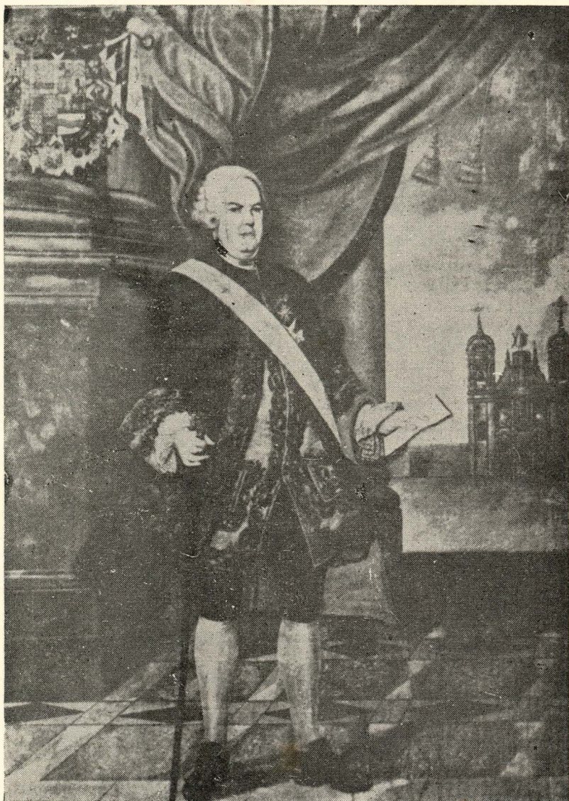
El Virrey Don Manuel de Amat