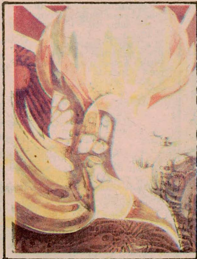
"CREPITACION DEL BARRO"

co y de la maraña, nace el verdor; en "Flor de la piedra", de la dureza y de lo cúbico nace la delicadeza de una flor convertida en ave.