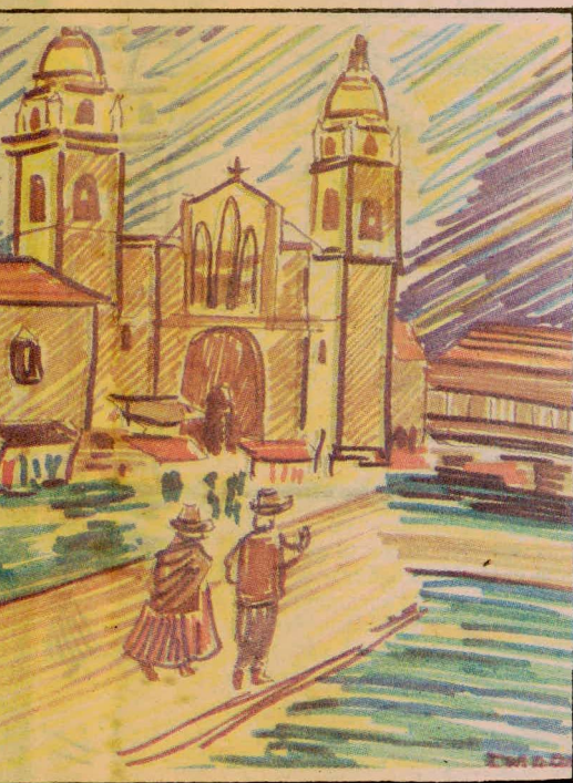
PLAZA DE ARMAS DE JAUJA, donde crecen las pequeñas yerbas de la ternura y la amistad del habitante andino.