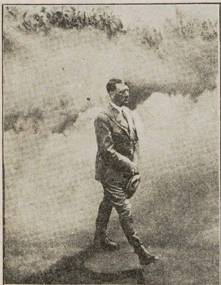
Hitler: inspiró la "Liga anti-asiática peruana".

No, aunque es cierto que Riva Agüero es un exponente muy claro de ese pasatismo fascista. Hay que distinguir entre los ideólogos fascistas y la prédica pública, que es mucho más simple y ajustada a las expectativas del grupo social al que se dirige. Un ejemplo de esto es la prédica que hacían sobre la URSS: el fascismo popular