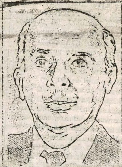
Del Prado del PCP: debe ser enfrentado con las bases.

Esta Convención o Congreso de Unidad debe contar con representantes acre-