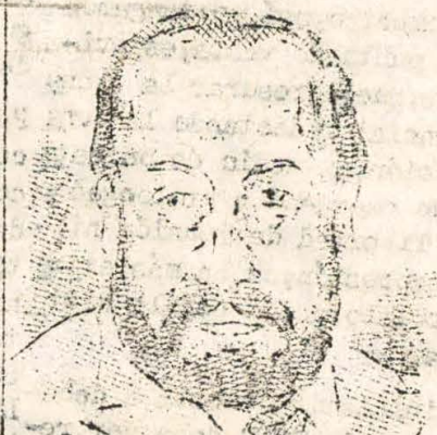
Ledesma: malas juntas

3) Este proceso es indesligable del desarrollo de campañas políticas de intervención comunes en el movimiento de masas, con el objeto de centralizarlo y o-