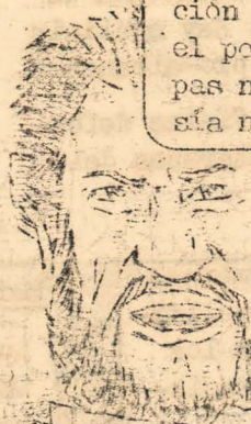
TROTSKISTAS AGENTES DE LA CIA (PC Mayoría)

Y en esta búsqueda desesperada de 'capitalistas democráticos' (que exploten poco, que les gusten las huelgas), los stalinistas no tienen reparo muchas veces en calumniarnos.