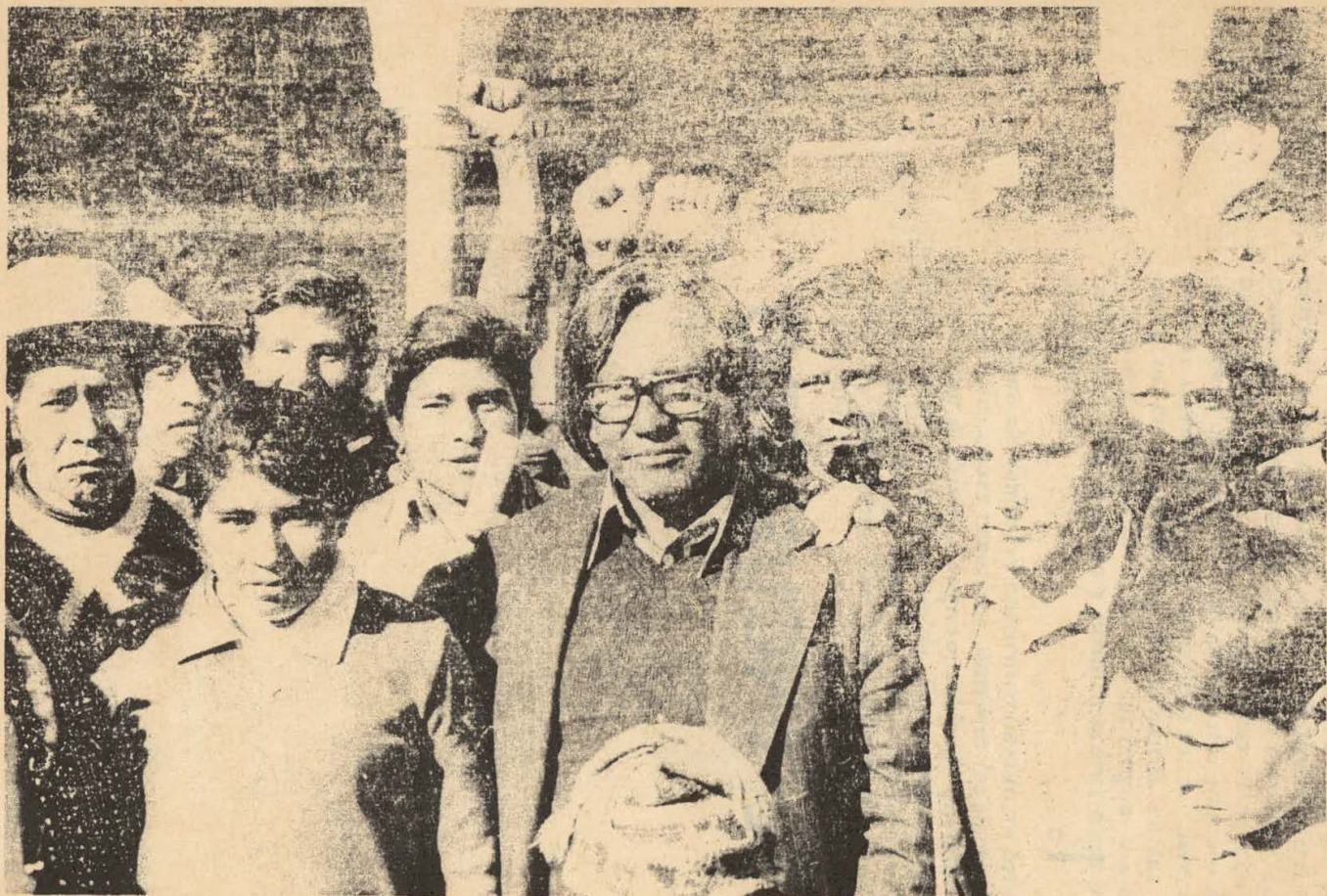
Algunos delegados al Encuentro, entre ellos un delegado boliviano