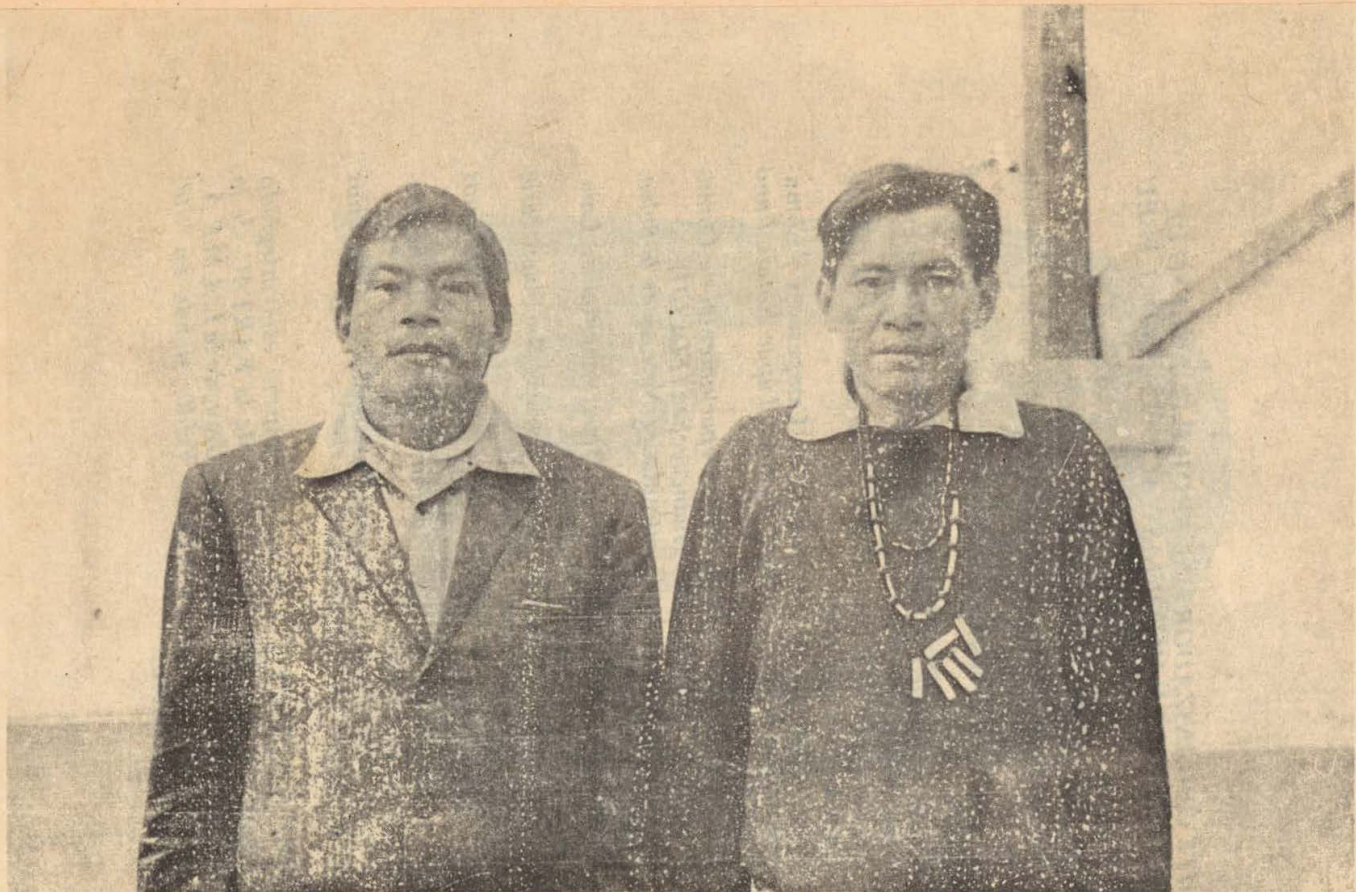
Dos delegados de comunidades nativas de la Selva (Aguaruna y Amuesha)