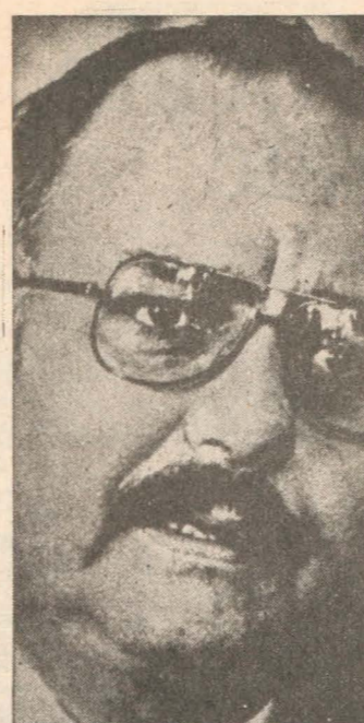
Somoza, criminal entre criminales, la justicia revolucionaria lo ejecutó.