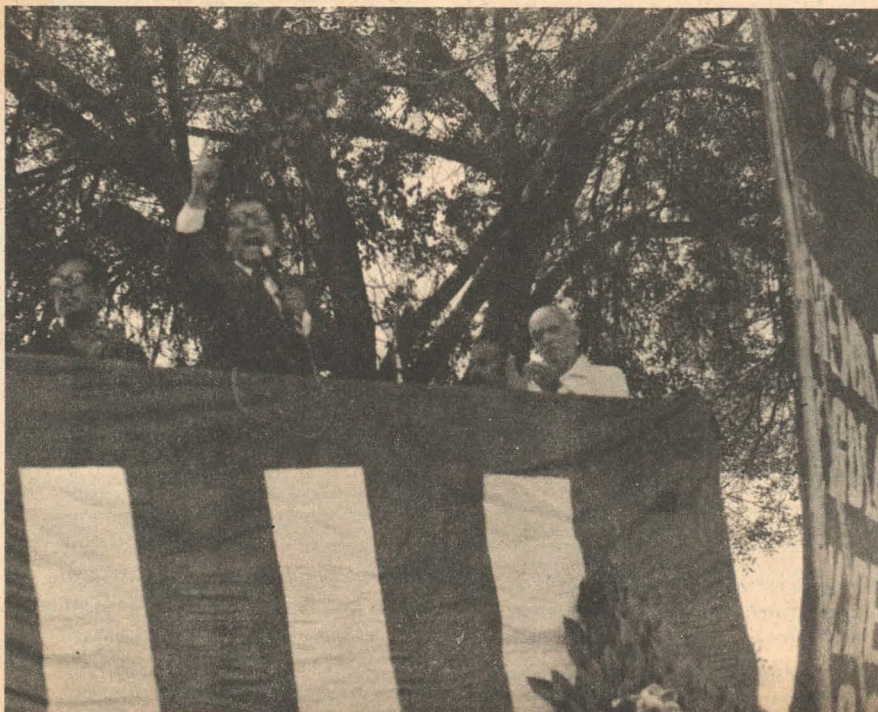
Unidad y lucha para la revolución . . . no para las elecciones.

militarista, pro senderista y ultraizquierdista, corre como alternativa revolucionaria fuera de IU, estan ampliamente demostradas, no ocurre lo mismo con la desviación reformista que practicamente ha ganado la hegemonía de ese frente. Es allí donde debemos identificar las tendencias y corregir mediante el debate político e ideológico las actuales posiciones de IU. Se trata entonces de plantearnos una discusión al margen de toda consideración conciliatoria o de "salvación del régimen democrático", bajo cuyo pretexto se incuban y desarrollan toda