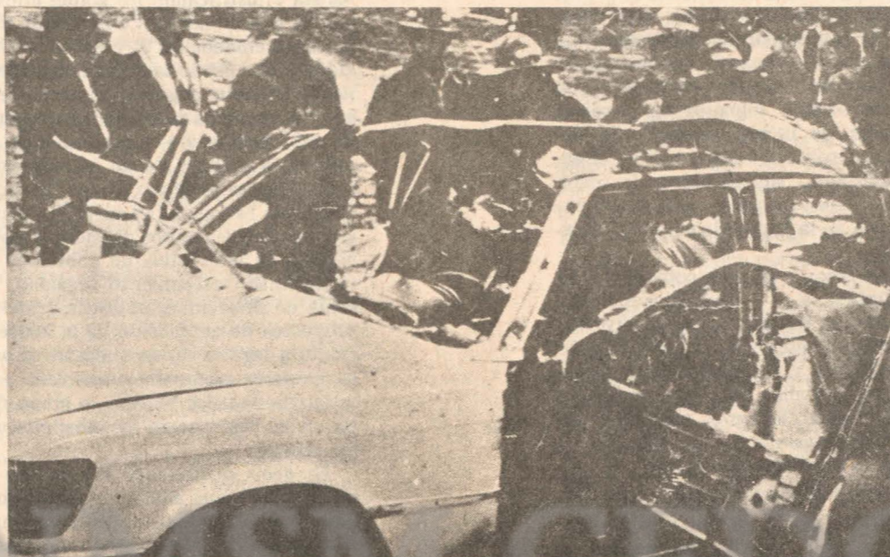
Así quedó el Mercedes Benz en el que viajaba el ex-dictador de Nicaragua.

Publicamos el presente artículo, aparecido en la revista POR ESTO, en homenaje al tercer Aniversario de la Revolución Sandinista; en el convencimiento de sus logros por la Reconstrucción de Nicaragua Libre y Antimperialista.