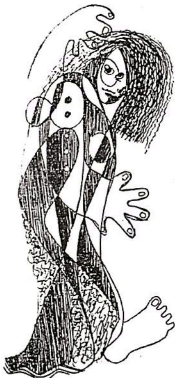
Colección "LA CASCARA del HUEVO" LOS HUEVOS DEL PLATA

el viento también guarda el secreto si inclina los árboles las ramas altas de los árboles y desparrama las hojas pequeñas de los pinos o si despeina un niño pobre o si sacude la falda de una mujer pobre no es para decir mi nombre la noche esta allá en el barranco donde estuvo siempre allá en el barranco este mar guarda el secreto no dirá a nadie que he muerto.