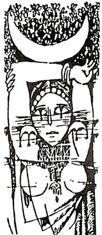
Dibujo tomado de la Revista Cometa de Papel (Tacna)