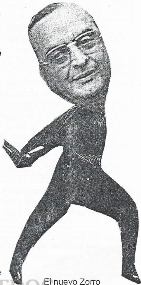
El nuevo Zorro

porque precisamente eso es lo que buscaba el film: mantener semioculto el poder del Zorro para dar cabida a una segunda lectura, que es precisamente la que han realizado estos críticos de cine que mencionábamos: es decir, explicar las proezas del Zorro a través de un nuevo talento que se le atribuye, este sería el don de mago. (Sigue al costalillo)