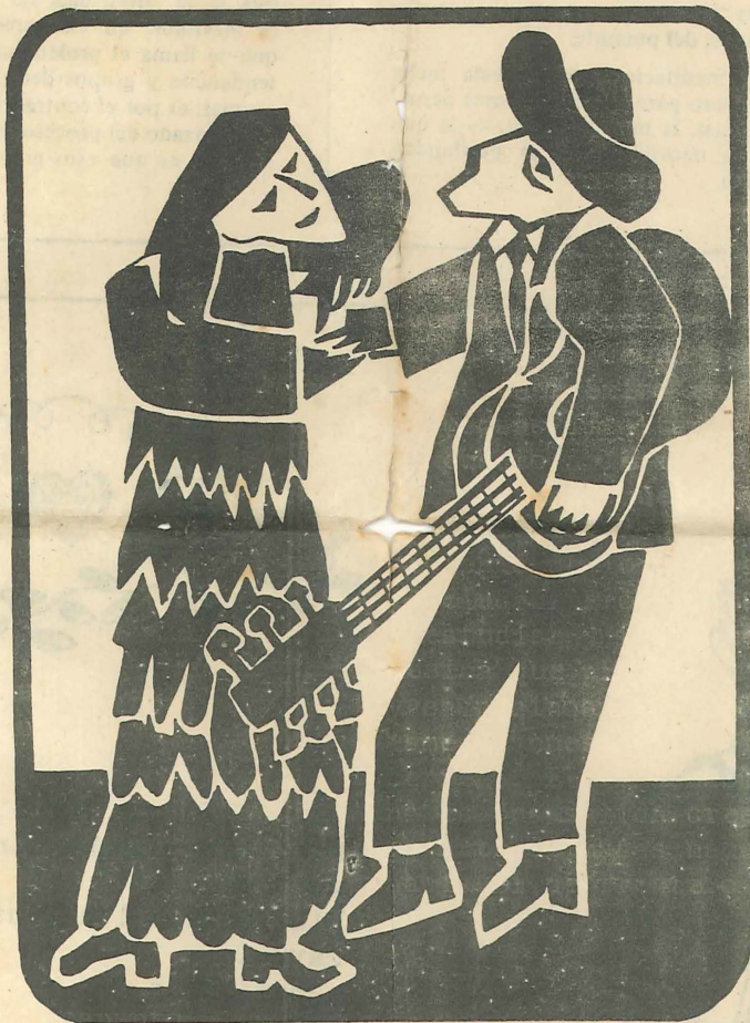
ALMA MATINAL (vals)

En el número anterior proponíamos a los escritores ciertos trabajos por hacer en la cuestión musical. Ahora proponemos a los músicos algunas cuestiones fundamentales que a nuestro parecer deben ser meditadas para obtener éxito en las labores. Hay cosas importantes que estudiar en cuanto a la música, como la estructura de la orquesta, la relación del todo de vida con los ritmos y la ideología de los migrantes serranos a la ciudad. Proponemos dos cosas: 1) estudiar y reproducir fielmente la música que practican nuestros obreros y campesinos 2) ir elaborando paralelamente nuestras aspiraciones en este terreno. El "chachacha-chilenizado" no es una salida creemos. El verdadero arte de masas nace del pueblo y va hacia él, de frente o de costado.