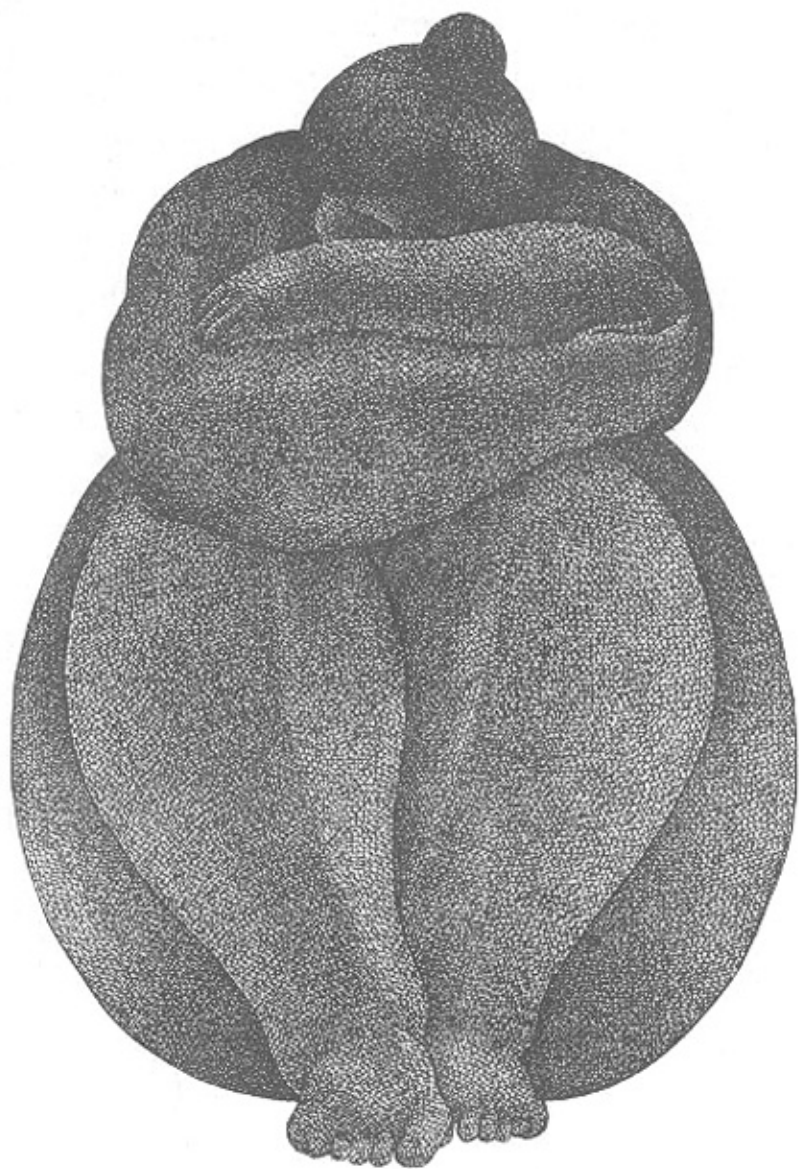
"Mundo Interior" (P.Y.)