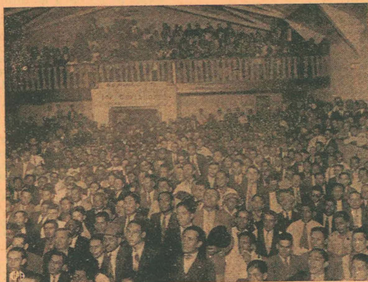
Vista parcial de la asistencia a la Asamblea Aprista, realizada el 15, en el Teatro "Royal" del Rímac

Nuestro cálido aplauso a esas masas de hombres y mujeres que acudieron la noche del miércoles al local del teatro Royal, a las que ingresaron como a las que tuvieron que devolverse a sus hogares por el interés y el fervor demostrado, en esta simple, pero significativa actuación política.