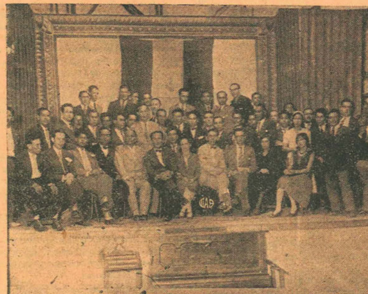
Instalación del Comité Departamental

Señaló el hecho trascendente de celebrarse el 15 de abril, una actuación aprista que ponía en relieve la fuerza abrumadora de nuestro partido, mientras se derrumbaba en el viejo mundo una de las más funestas monarquías. Los lazos históricos que nos unen a España, conquistadora y retrógrada, parecían querer trocarse hoy con el gran paso de liberación que traía la República. Para nosotros, la caída de los partidos tradicionales representantes del feudalismo criollo, era también como la