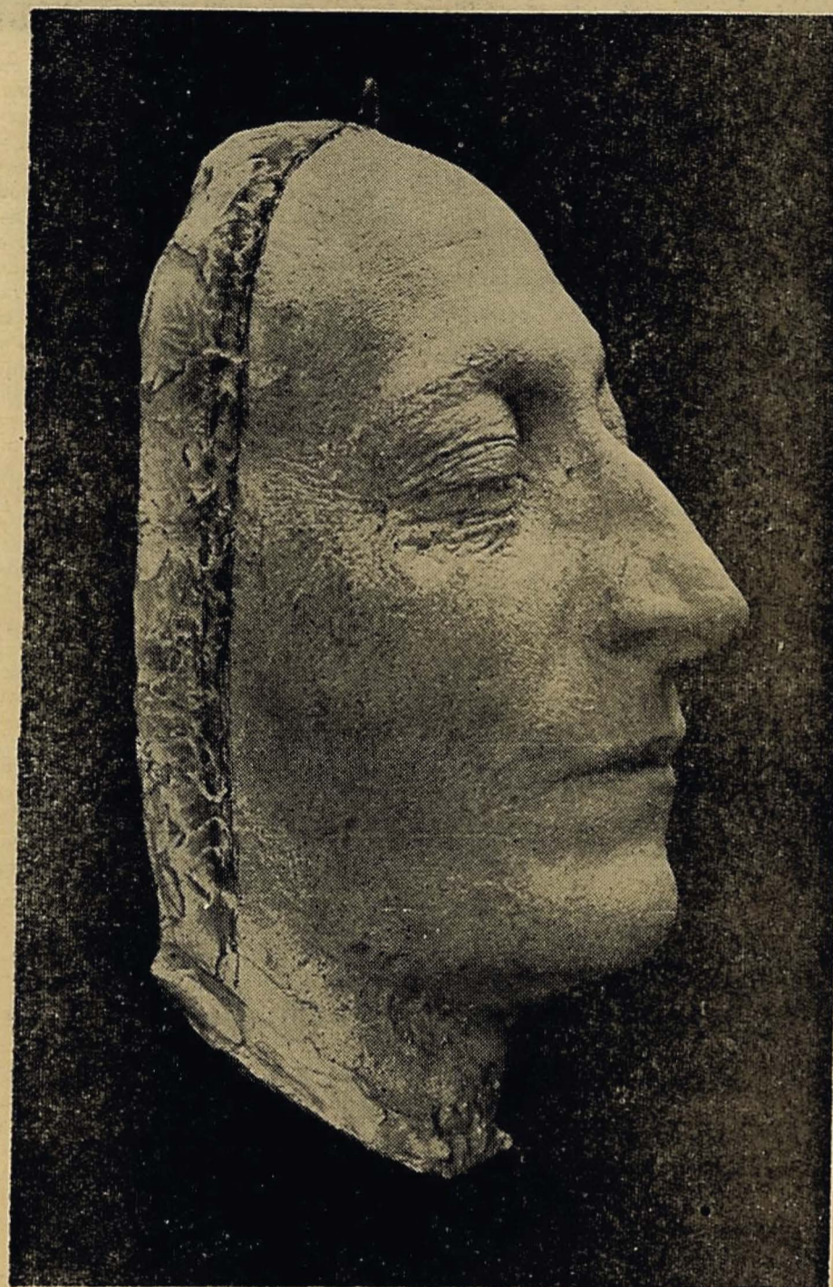
Mascarilla del desaparecido escritor Sebastián Salazar Bondy, obra del escultor Gastelú Macho.

burgo, Noruega, Países Bajos, Polonia, Suecia, Checoslovaquia, Turquía, etc.) el autor que desea prohibir la reproducción debe indicarlo de modo expreso a la cabeza o al pie del artículo. En otros (Haití, Perú), la obra reservada debe ser objeto previamente de un depósito