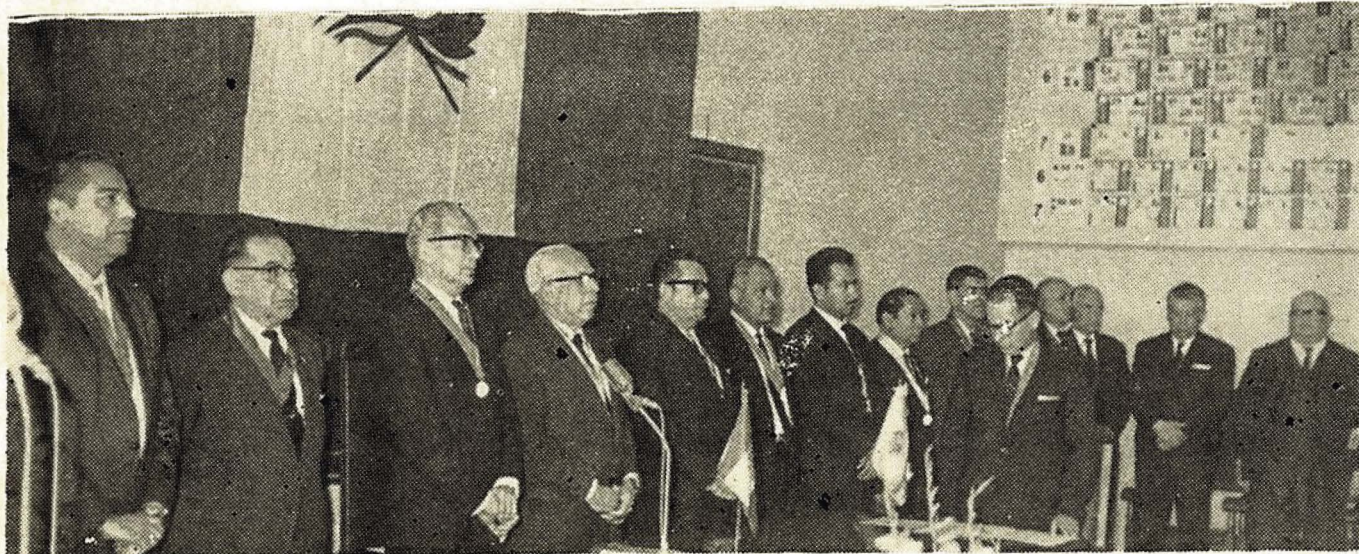
Durante la actuación central con motivo del 25º aniversario de la Facultad de Farmacia y Bioquímica.

Los universitarios farmacéuticos del Perú confraternizaron con actividades deportivas, destacándose la realización de las Primeras Olimpiadas Inter-Facultades en Farmacia y Bioquímica.