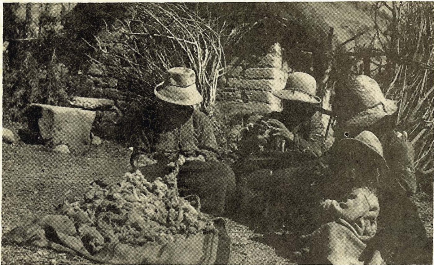
Las sociedades ágrafas, donde la antropología centra sus investigaciones a fin de captar la estructura y los mecanismos culturales en estado elemental.

Hay otra idea que es la analogía que existe entre el intercambio de palabras y el funcionamiento del sistema de una sociedad. No solamente Saussure, sino también Marcel Mauss en un interesante ensayo, en donde estudia la sincronía de la reciprocidad a través del intercambio de dones y contradones existe una similitud; similitud entre la comunicación y la sociedad. Mauss considera a la sociedad como un complejo de intercambios: de palabras, de bienes y servicios; cuyas realidades estudia la economía y la antropología, por separado. Lévi-Strauss, por ejemplo, estudia antropológicamente el intercambio de mujeres. Y es que en la estructura total de un sistema social se dan in-