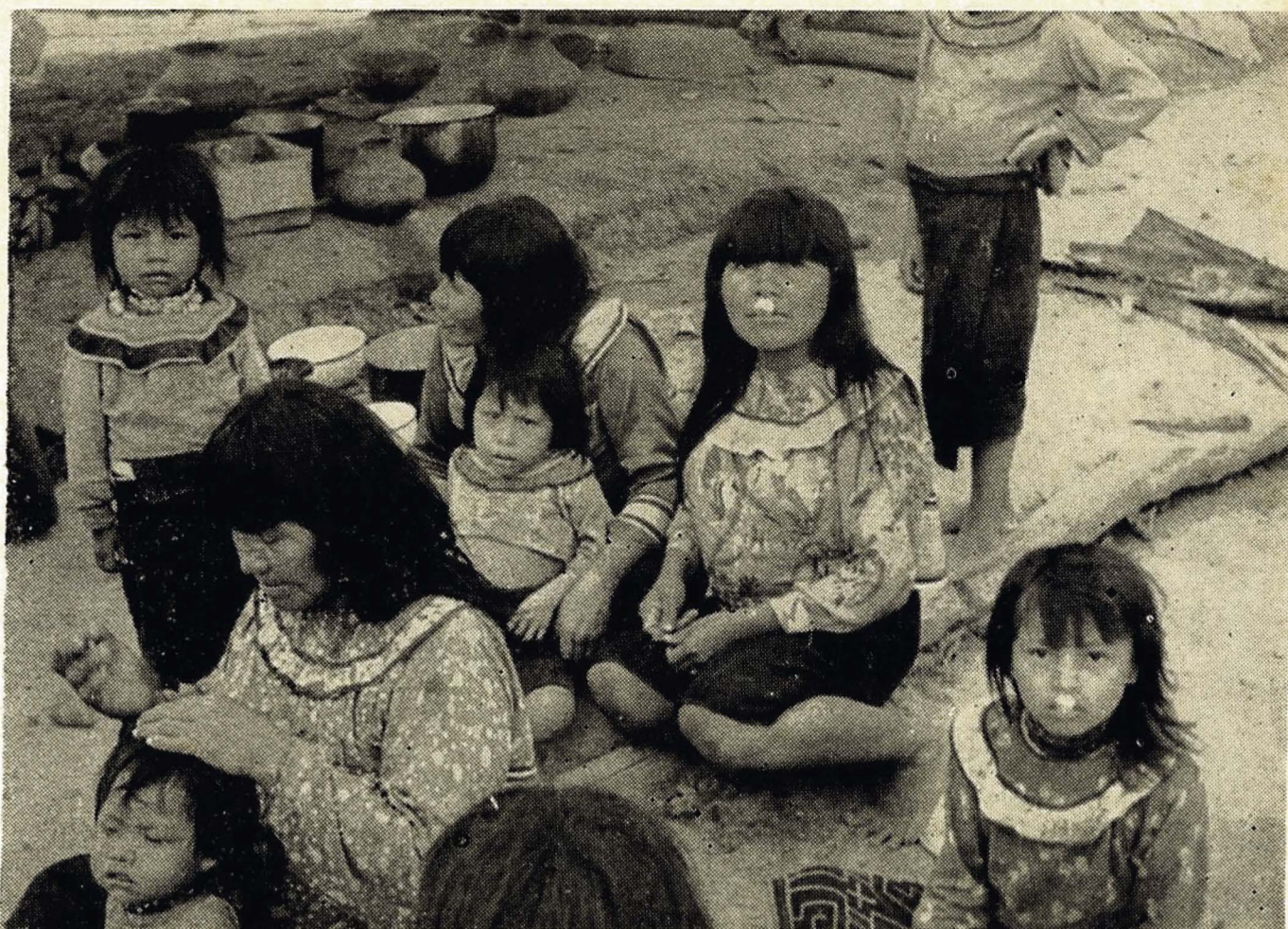
Una familia de la tribu Chama, en la zona del Ucayali.