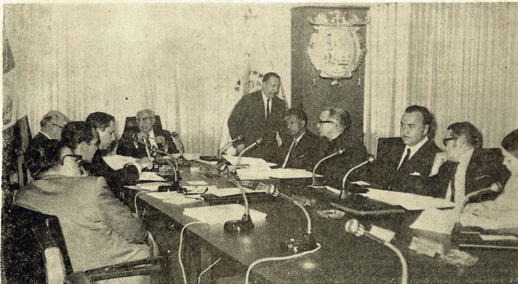
Rectores de las universidades de América Latina, discutieron los problemas que afectan la vida académica en la hora actual.

Luego, en el curso de las sesiones siguientes se discutieron puntos de interés común de la vida universitaria del continente.