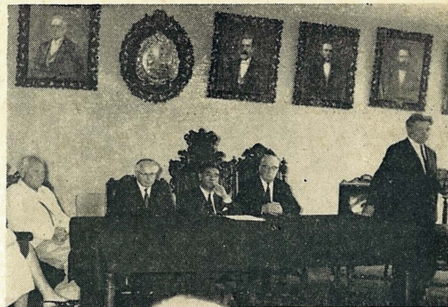
Científicos soviéticos, especializados en estudios marinos, ofrecieron una conferencia en la Facultad de Ciencias, sobre sus investigaciones en el Pacífico Sur.

El Consejo del Dpto. de Antropología acuerda por unanimidad: