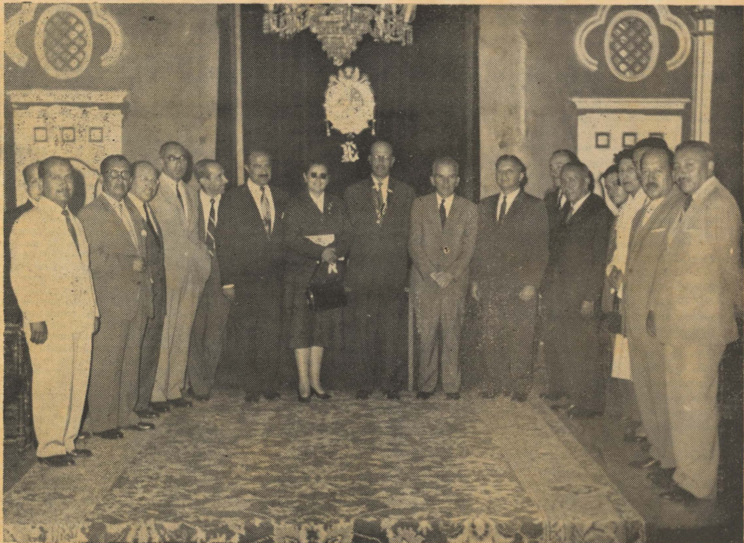
El Decano de la Facultad de Educación inaugurando el año académico de dicha Facultad en los primeros días del mes de Abril. Se rumorea que esta Facultad habría presentado una propuesta para solucionar el problema de los alumnos de La Cantuta.