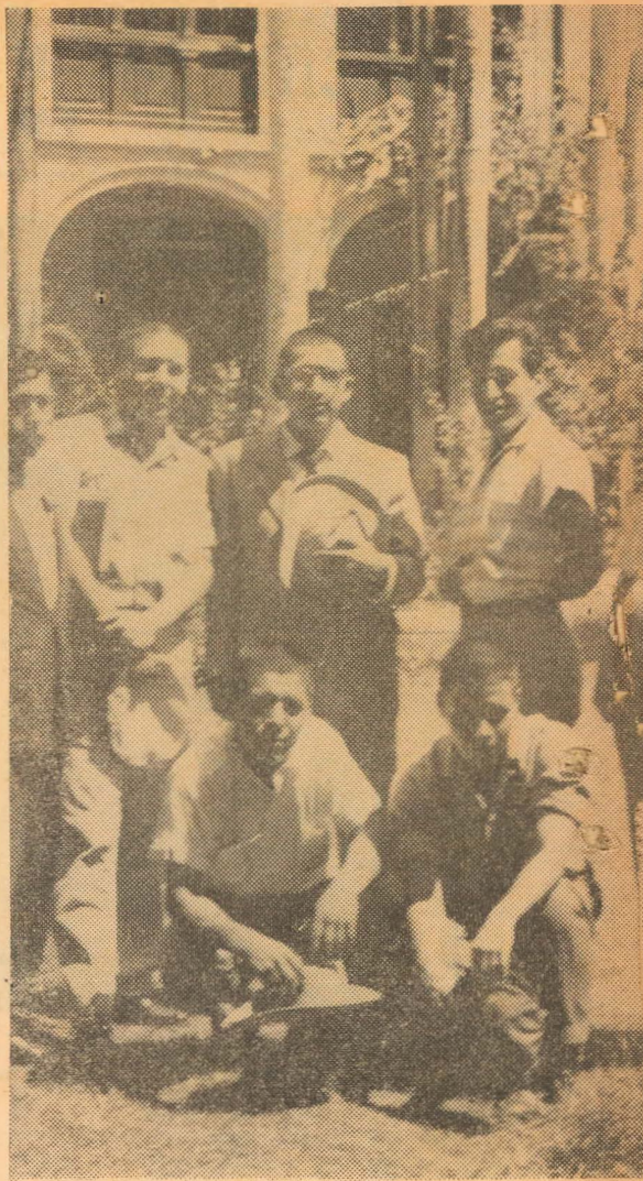
Cachimbes simpatizantes de "Horizontes sanmarquinos posan especialmente para esta revista.

Eran las tres de la tarde y estando abierta la Audiencia, se procedió a pedir la prueba testifical. Los magistrados silla donde se