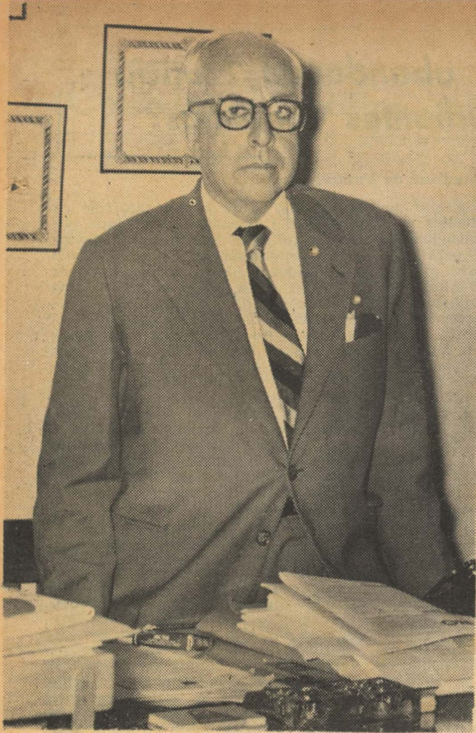
Señor Doctor Luis A. Sánchez, ex-Rector de San Marcos y elegido recientemente Presidente de la Asamblea Universitaria confía en que, pese a todos los problemas surgidos, se puede llegar a un feliz acuerdo. Todos confiamos con optimismos que así sea, para el bien de todos los estudiantes, Profesores y ¡el Perú!