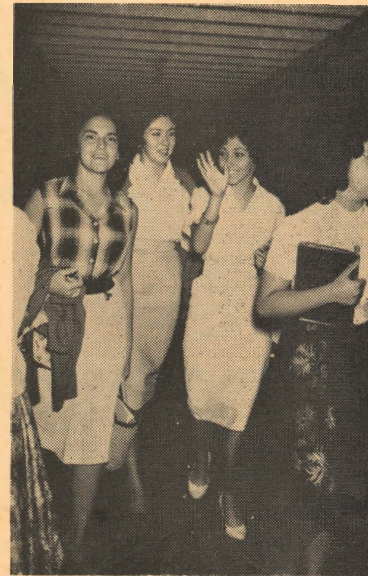
Desborde de gracia después de un esfuerzo de atención en la clase.