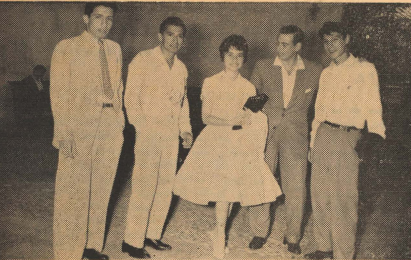
Estos jóvenes estudiantes nos muestran su simpatía con una sonrisa para "Horizontes Sanmarquinos".