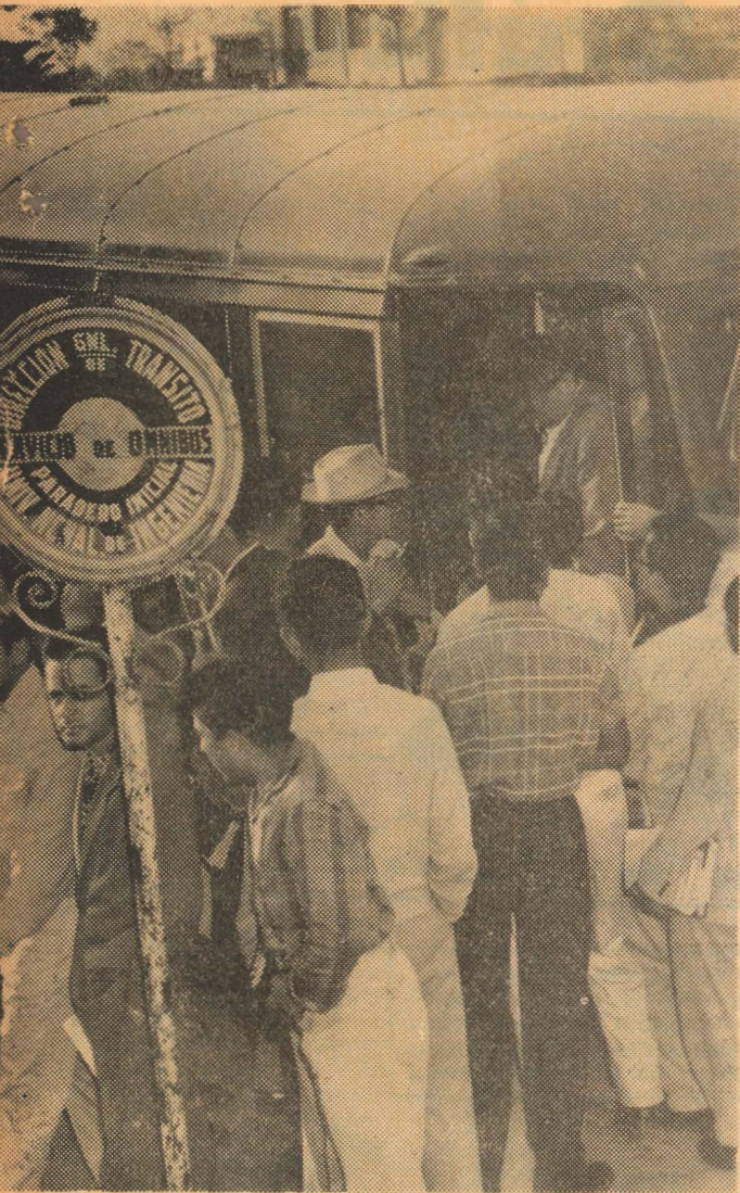
Estudiantes de la Universidad de Ingeniería que con razonada convicción se reincorporaron a sus clases. Pese a demanda contraria de los organismos estudiantiles extremistas.