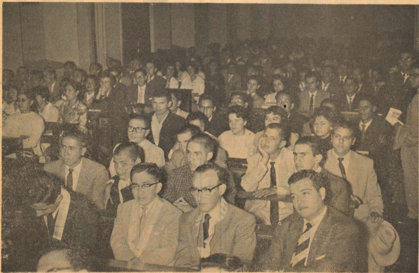
Estudiantes de la Universidad Católica que decidieron al igual que los estudiantes de Ingeniería abandonar la huelga considerando haber satisfecho sus demandas.