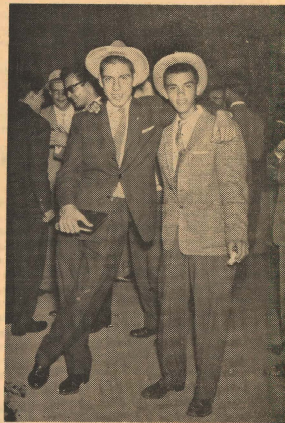
¿Quién sostiene a quien? ¿Parecen hermanos verdad?