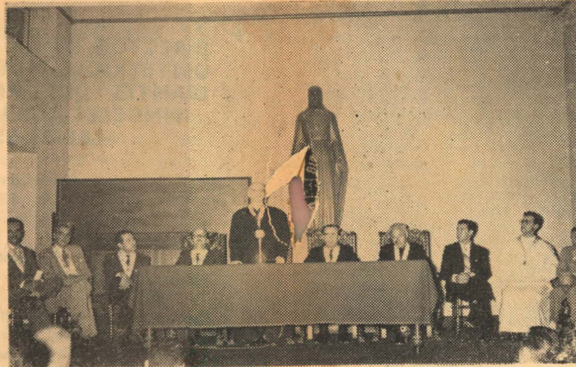
Momento solemne de la apertura del Año Académico en la Universidad Católica.