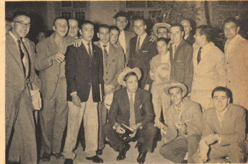
Nuevos valores en embrión, "cachimbos" enriquecen los claustros de la prestigiosa Casa de Estudios.