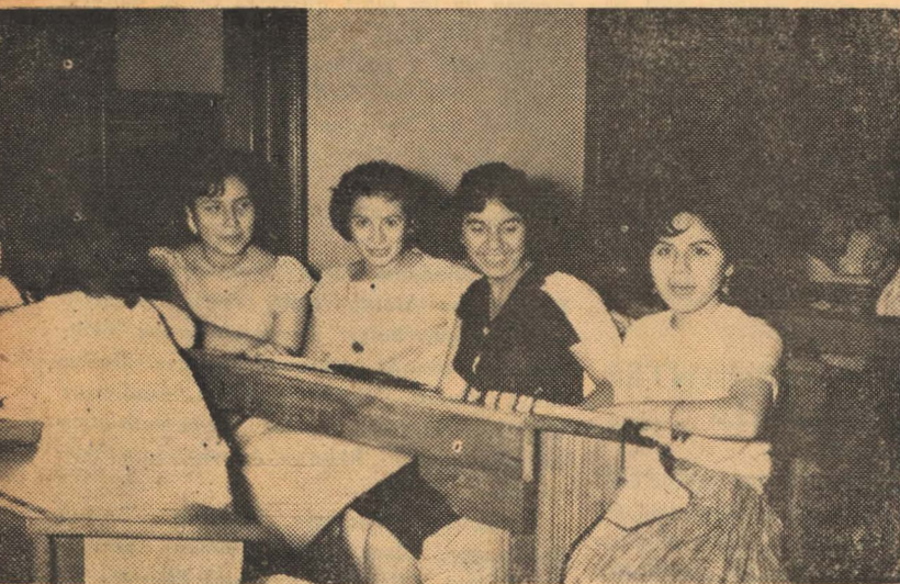
Chicas guapas que no pueden ocultar su sorpresa ante la indiscreción del lente de "Horizontes Sanmarquinos".