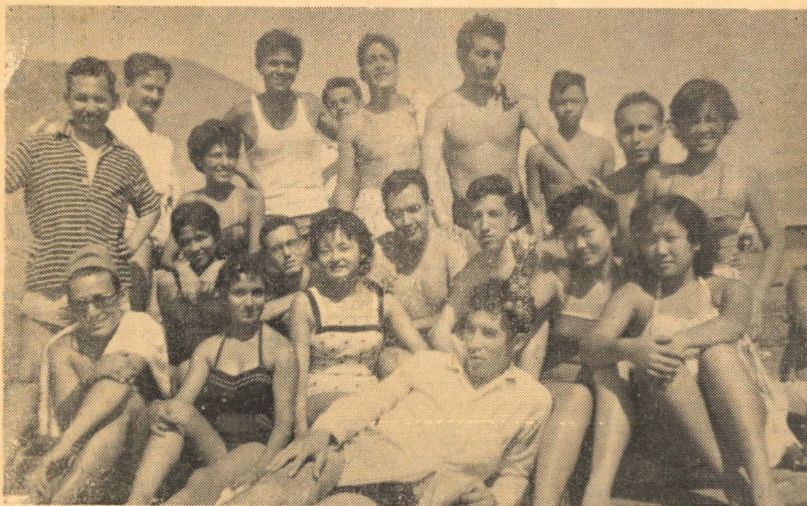
Estudiantes de las Facultades de Derecho y Económicas posan para "Horizontes Sanmarquinos en una playa del Sur.