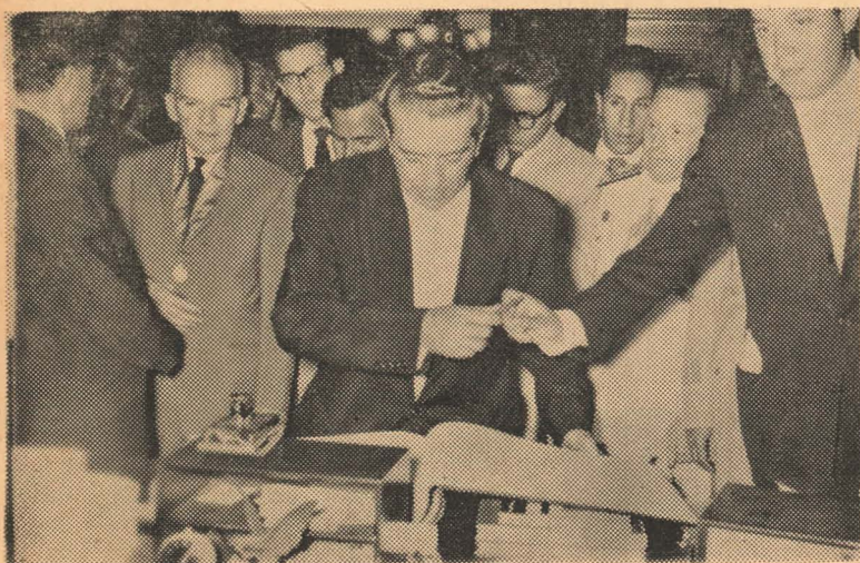
El Licenciado D. López Mateos a punto de firmar el Libro de Visitantes ilustres a la Universidad.