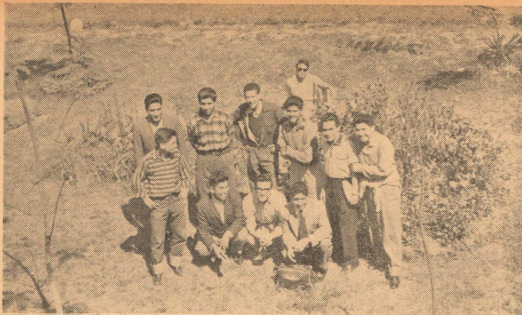
QUE BUENAS VACACIONES Estudiantes Sanmarquinos disfrutan de sus vacaciones en un paseo campesino.