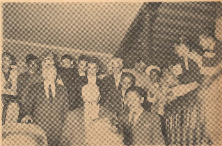
El Presidente es abordado por algunos alumnos que lo saludan y le hacen algunas preguntas.