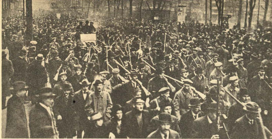
Noviembre de 1918: los obreros armados dominan las calles de Berlín; pero la dirección quedó en manos de la socialdemocracia derechista.