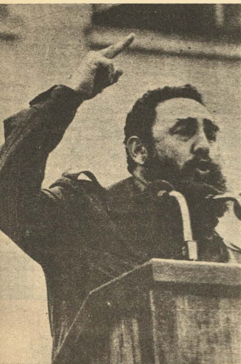
Fidel. Irrecusables cargos contra los Estados Unidos.

El propio Fidel concretó, también, la denuncia de que el gobierno de Estados Unidos hace todos los esfuerzos por sabotear la realización de la VI Cumbre de los No Alineados que se llevará a cabo en setiembre del próximo año, en Cuba.