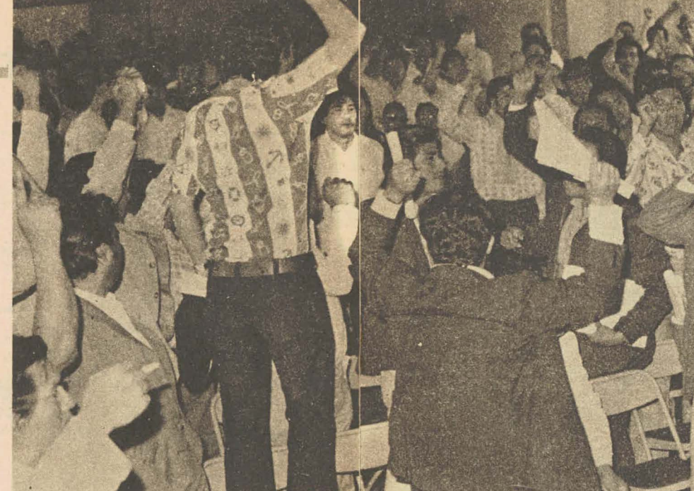
En busca de sus propias ventajas, ADEX postula la desaparición total de la ya casi inexistente Comunidad Industrial.

Aunque controlada por las más grandes empresas del sector, con influencia decisiva en su Junta Directiva, ADEX ha implementado una activa campaña para ampliar sus filas, buscando atraer a los medianos y pe-