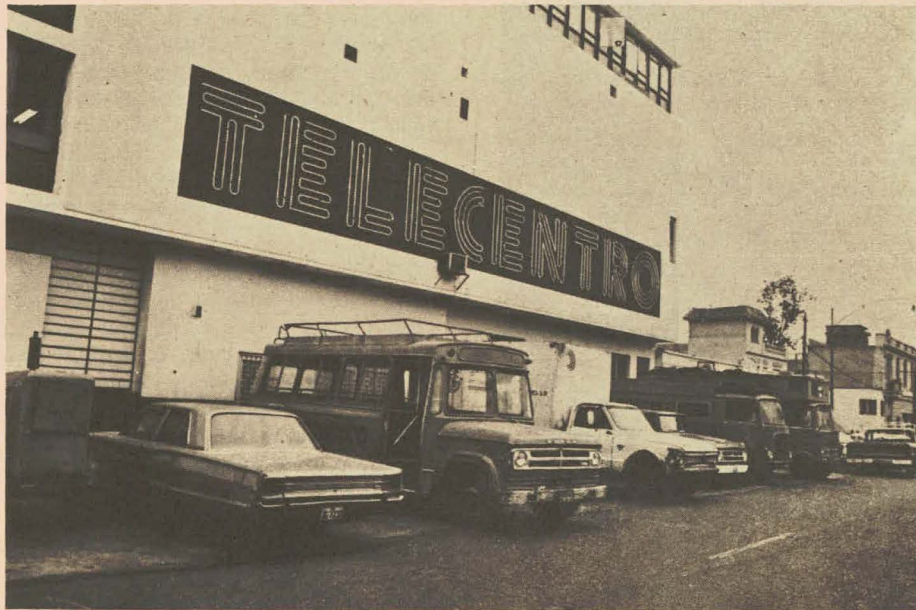
TELECENTRO. "Empresa" no reconocida legalmente.

Sin embargo, la figura es precisamente a la inversa: la televisión y los medios en general funcionan como modeladores de los gustos, intereses y concepción del mundo del espectador. Un niño, antes de asistir al colegio, ha visto ya muchas horas de televisión y es allí donde empieza su deseducación (violencia, individualismo y otros va-