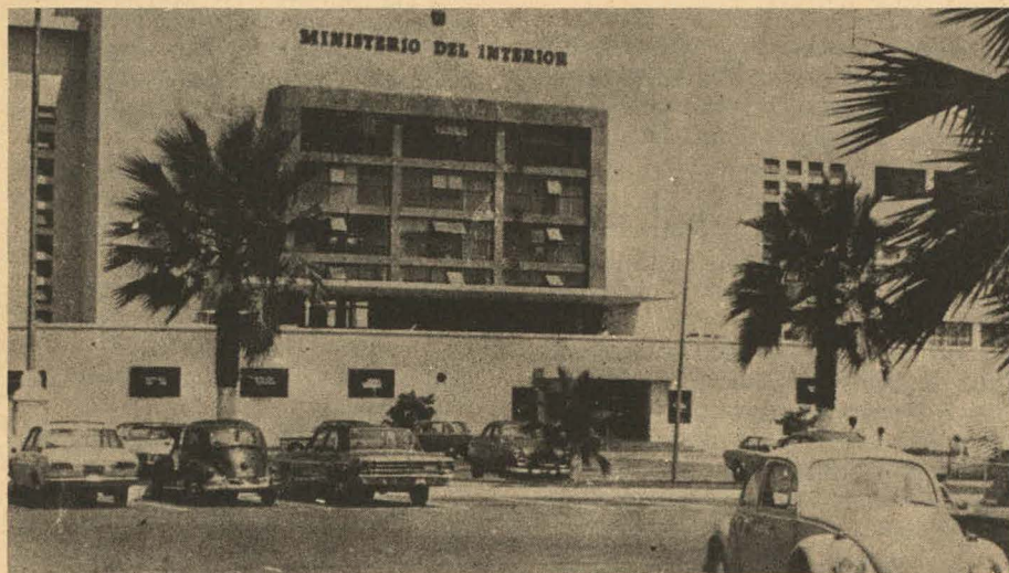
El aparato represivo sigue intacto. La "austeridad" sólo funciona contra el pueblo

Y terminó la conferencia sin que pudiera conocerse la pregunta y menos la respuesta.