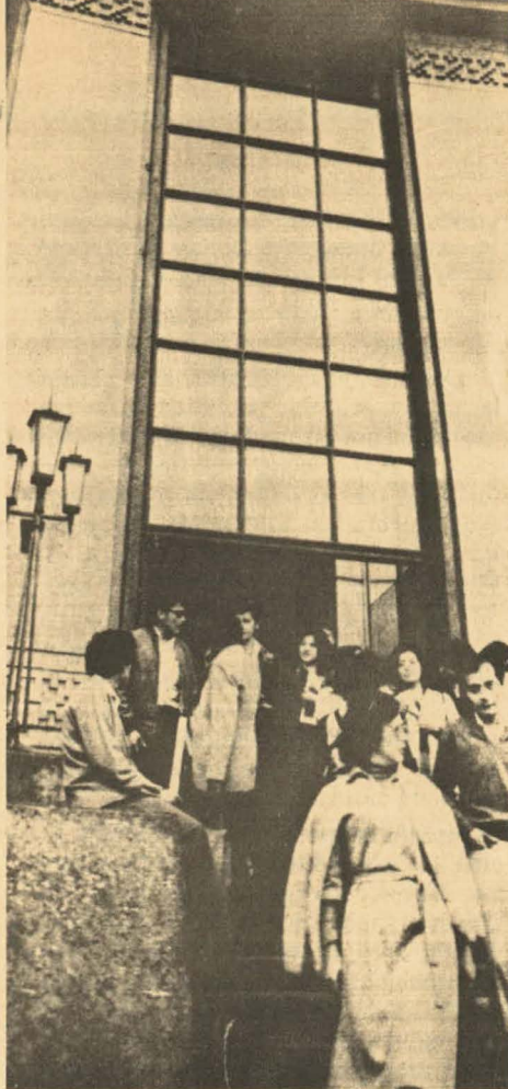
Perder el trabajo siempre es una tragedia. Ahora, mayor.

El desequilibrio de las finanzas públicas sólo se ha visto limitado por la sustancial rebaja de las remuneraciones de los empleados públicos (cuyo poder adquisitivo ha disminuído en más de un tercio desde 1973), por la disminución de las inversiones públicas, con la consecuente parálisis de la construcción y multiplicación de la desocu-