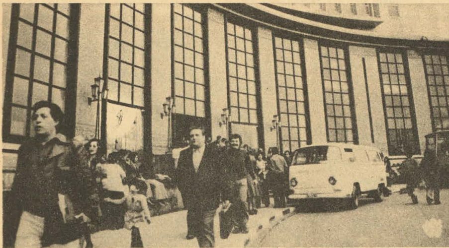
Los contratados, las primeras, seguras víctimas.

Según datos de INAP, los empleados públicos, incluidos los de las empresas