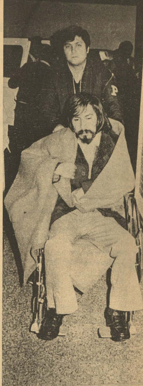
La marcha rescató a los huelguistas de hambre que estaban en condición de prisioneros.

tentos que ha hecho el Gobierno por desconocer a la Federación, entrevistándose con algunos dirigentes de Sindicatos con el fin de crear el divisionismo. La Federación rechaza estas maniobras —dijo— así como la Comisión Tri-Partita propuesta por Julio Cruzado, dirigente máximo de la CTP aprista, por constituir un evidente obstáculo a la solución inmediata de la Huelga, que deben darla el Gobierno a través de la Federación Minera. Rechazó, igualmente, los intentos de la Southern Perú de quebrar la Huelga en el Area de Ilo mediante un ofrecimiento económico, cuando lo que se persigue con la lucha es la reposición de los despedidos. Se refirió también a las declaraciones del Ministro de Vivienda, Gerónimo Cafferatta, en que calificaba a los mineros en Huelga de "malos peruanos", remarcando que ellos habían puesto todo de su parte para llegar a una solución y no así el Gobierno.