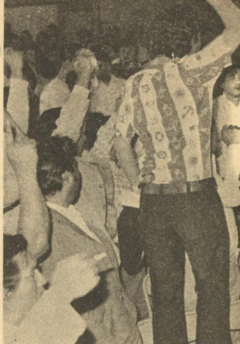
En busca de sus propias ventajas, ADEX postula la desaparición total de la ya casi inexistente Comunidad Industrial.

Aunque controlada por las más grandes empresas del sector, con influencia decisiva en su Junta Directiva, ADEX ha implementado una activa campaña para ampliar sus filas, buscando atraer a los medianos y pe-