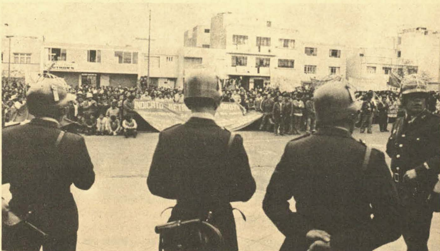
Los cascos de la represión frente a la masa minera en el Hospital de Policía.

La entrada de los mineros a Lima, el lunes temprano, fue verdaderamente impresionante. Por la Carretera Central, en la zona de Ate y Vitarte, se fueron