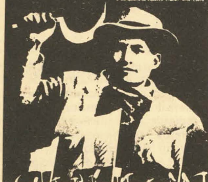
Confederación Campesina del Perú - CCP V Congreso Nacional Unidad de los Pobres del Campo para la Revolución 20 al 23 de agosto de 1978 2. Campesino de Tumbes. Chacra, Areca, Cuzco

Antes de la proyección de cada largometraje se proyectará un corto documental sobre diversos aspectos de la actualidad rumana. ■