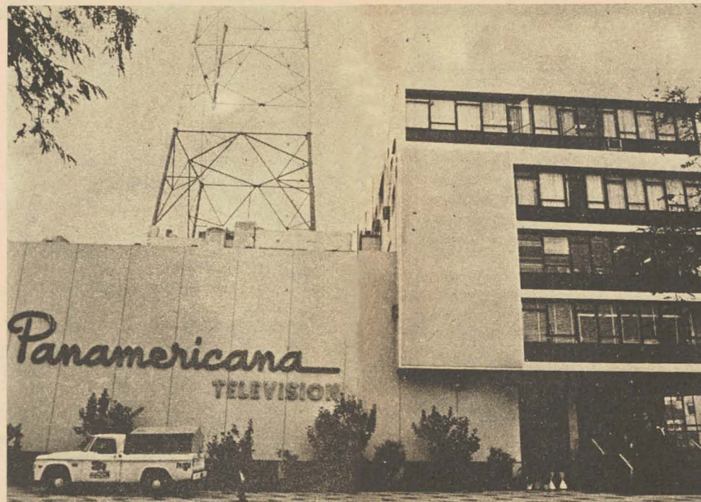
Panamericana. El Estado nunca entró realmente.

Así sucedió con los canales 2, 9 y 11, que dejaron de operar en Lima y