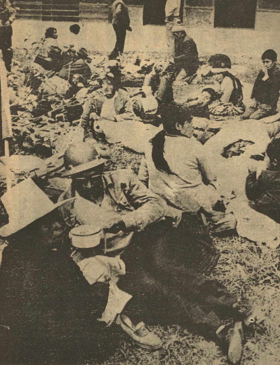
La Olla Común, breve refugio de los combatientes.