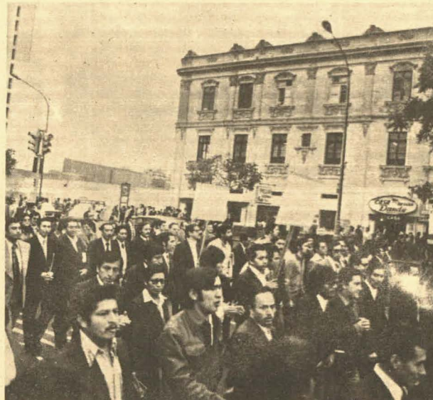
La tregua bancaria es hasta el jueves 24.