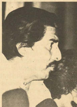
Avelino Mar. Serias denuncias.

mos respetar la libertad hasta donde es posible y conveniente (...) por que es muy difícil establecer el límite entre la justicia y la libertad". DL 22264 autoriza a empresas del estado a reajustes de precios periódicos, transferencia y reducción de presupuestos y, por consiguiente se autoriza a los titulares del sector para reducir personal y necesidades de bienes y servicios, supresión parcial o total de Direcciones, Departamentos, Oficinas u otros elementos, etc.