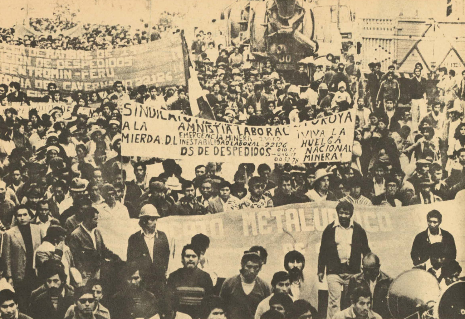
La primera gran marcha minera llegó a Lima. Otras vienen desde distintos puntos del país.

La Huelga Minera, acatada en todo el país, es una evidencia más de la consecuencia clasista del movimiento obrero. Las banderas levantadas son las de la solidaridad: ellos exigen, como punto principal para levantar la medida de lucha, la reposición de todos los trabajadores despedidos al amparo de los nefastos 0-10-77 y 0-11-76. Su lucha es la del pueblo y por el pueblo.