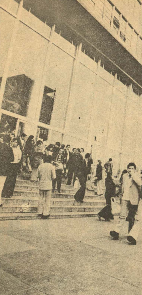
Organizarse y forzar una alternativa valedera, es la tarea.

del Estado llegan a los 600 mil. Se afirma que los criterios a seguir por los responsables de la aplicación de las draconianas medidas serían los siguientes. Serán despedidos: