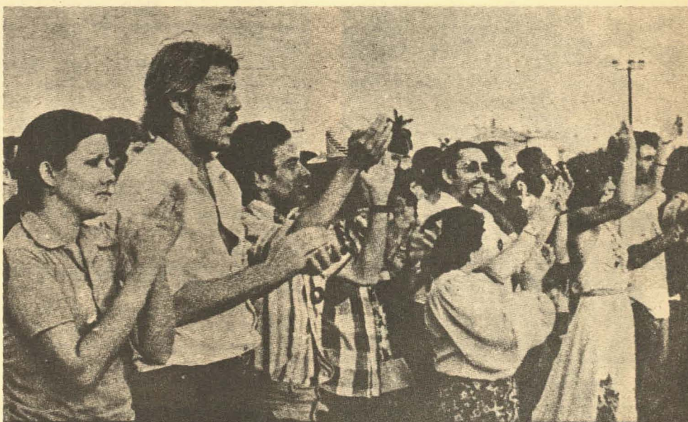
Todo el Festival de la Juventud tuvo un lema "Por la solidaridad antimperialista, la paz y la amistad."

Las canciones tuvieron un mensaje antimperialista, los encuentros poéticos un definido sesgo, los mítines de solidaridad con distintos pueblos del mundo que padecen dominación y agresión fueron drásticas recusaciones contra el imperialismo, los festivales de cine y teatro fueron testimonios crudos de la ofensiva yanqui. Hasta los