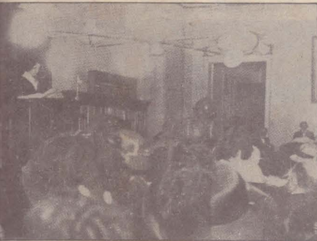
LAS PRIMERAS FEMINISTAS ANTE LA LEY