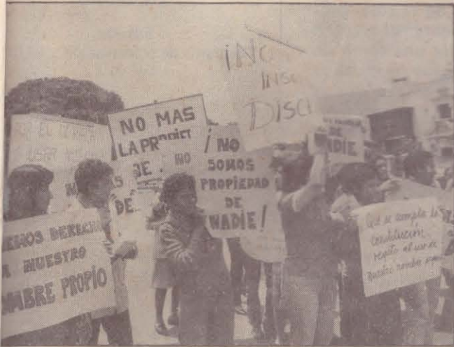
NUEVO CODIGO CIVIL: DE CAL Y ARENA