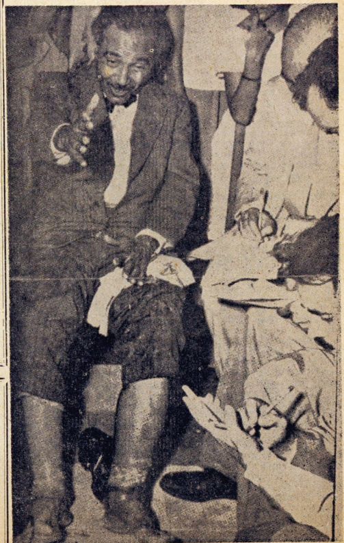
Pedro Albizu Campos, líder nacionalista puertorriqueño muestra sus tobillos tremendamente hinchados, como consecuencia de los "grillos" que le pusieron los carceleros yanquis. (Ver amplia información en página interior)