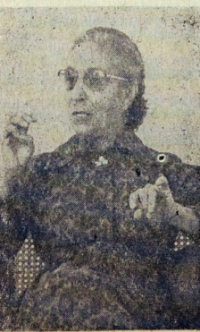
LAURA DE ALBIZU C. voz idiomera...

Albizu Campos fue sitiado y reducido en su casa, después de violenta lucha. Más de 3.000 hombres, mujeres y niños fueron encarcelados. Por camionadas las fuerzas invasoras sacaron familias campesinas de sus hogares. Luego los procesos amañados, la aplicación de las leyes de la mordaza y, finalmente el ataque en prisión con radiaciones y otras armas científicas a los patriotas, especialmente Albizu Campos. La resistencia heroica de los puertorriqueños conmovió al mundo. Una de las naciones más pequeñas de la Tierra, sin armas, sostuvo su derecho a la libertad e independencia en batalla contra el imperio más poderoso de todos los tiempos. La revolución de 1950 constituye el hecho más trascendente de la historia de Puerto Rico. Desde esta época el insigne lu-