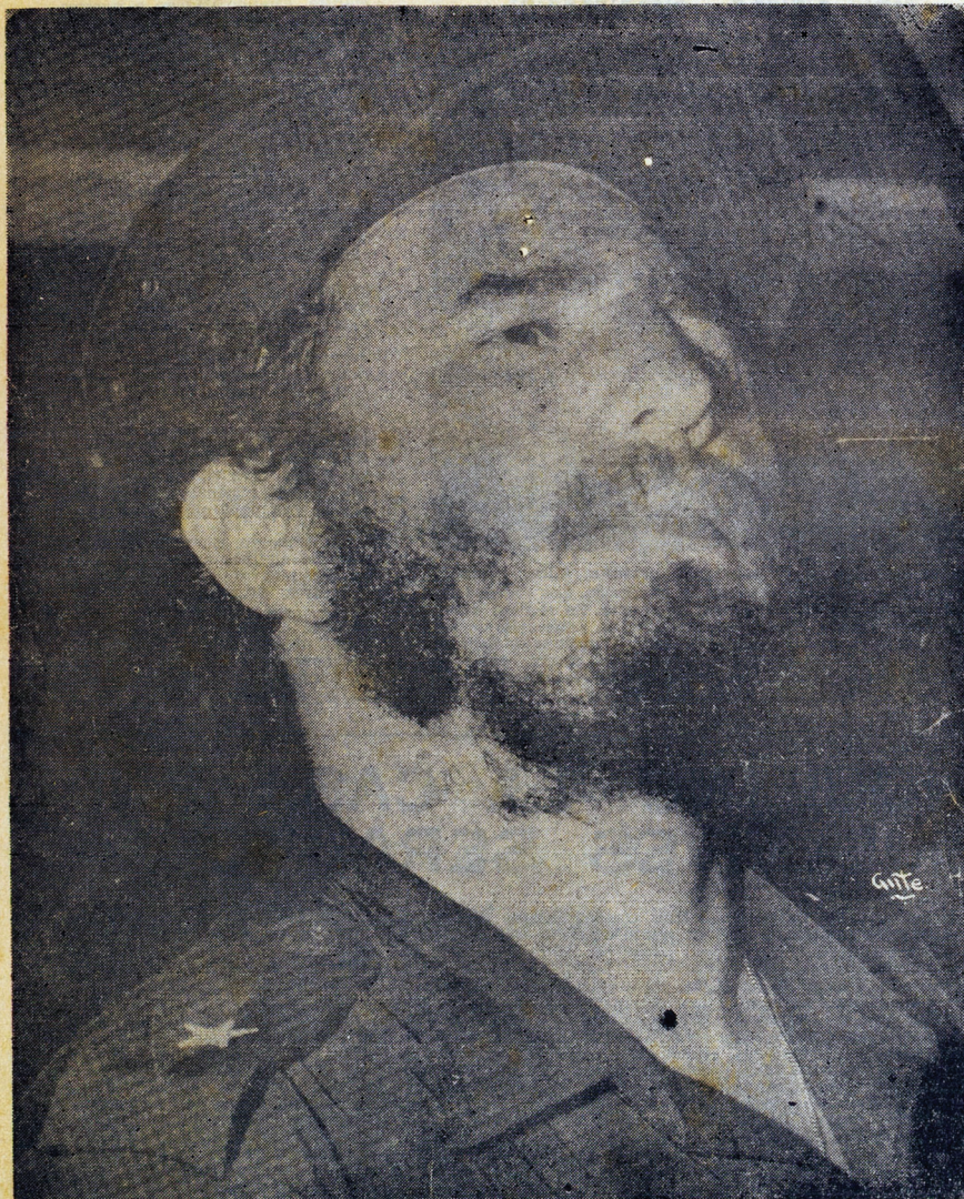
Aquí apreciamos a Fidel Castro, de 34 años, líder continental de la generación obrera campesina latinoamericana a la que las circunstancias históricas permitirán ser reconocida como la constructora del socialismo en Latinoamérica. Fidel ha pasado a la historia por haber hecho realidad indestructible todo aquello que los reformistas, los burgueses calificaron de utópico: una revolución de jóvenes, casi adolescentes, extirpando al imperialismo en las propias narices de la capital mundial de la opresión: Estados Unidos.—