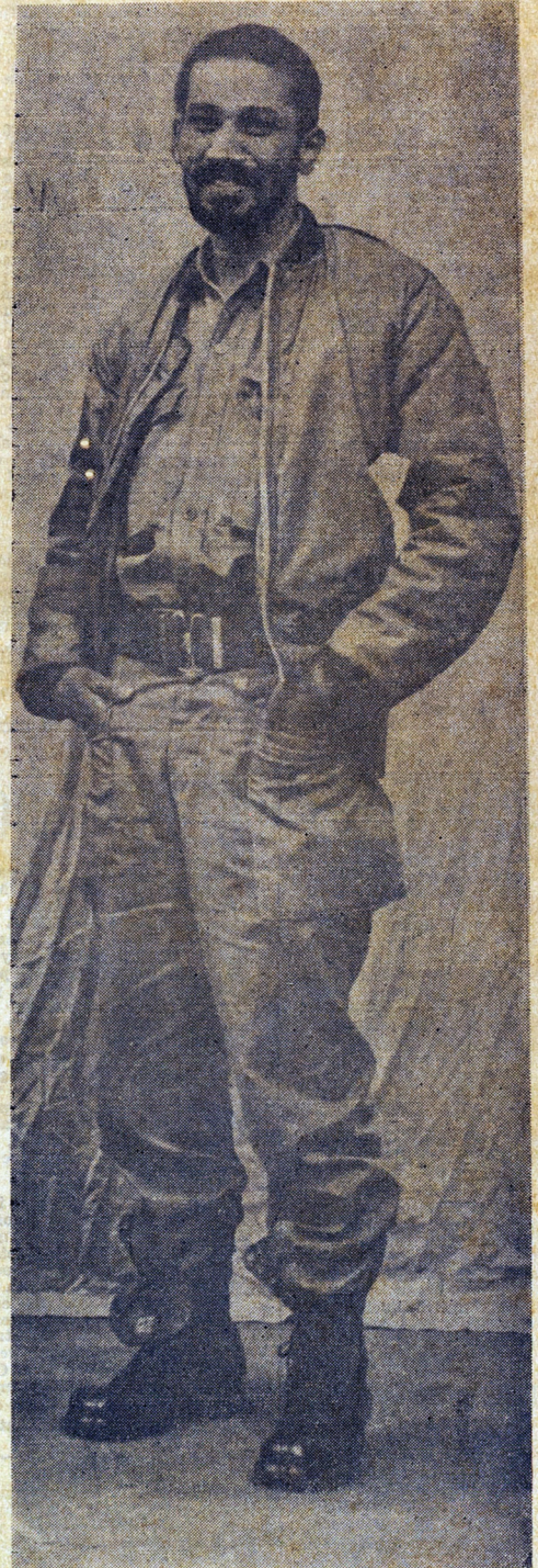
Aquí vemos al Comandante Juan Almeida, de 32 años, del color de Lumumba, el gran líder del Congo. Fue campesino antes de la Revolución hoy es uno de los jefes del Ejército más popular de la tierra. La historia verá en él el símbolo de quienes destruyeron a la infantería de marina y a los traidores mercenarios —los correligionarios de los cruz cobos, diezsilveiras y ferreyros— en la simbólica Bahía de los Cochinos.