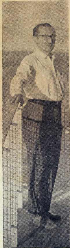
LUIS DE LA PUENTE