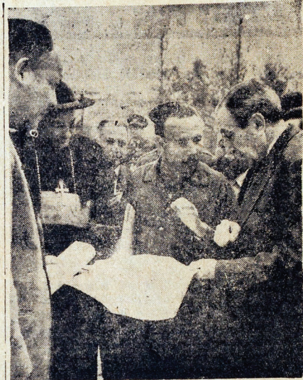
VIVIENDAS PARA TACNA.— El Ministro Beltrán escucha las explicaciones de un funcionario durante su visita al lugar donde se levantará el primer agrupamiento de viviendas populares en Tacna. El Premier retorna hoy en la tarde a Lima.

LA PRENSA.—Lima, Lunes 4 de Setiembre de 1961