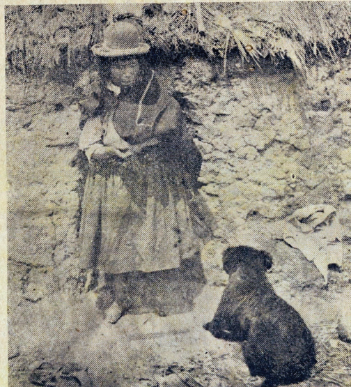
FAMILIAS DESARRAIGADAS DE SUS EMPLAZAMIENTOS NATURALES