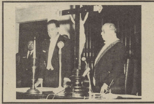
NO PODIA SER DE OTRA MANERA

Nosotros sí apelaremos a las armas que Belaunde ha renunciado a usar e iremos hasta las últimas consecuencias. Nosotros apelaremos a las masas y a la violencia responderemos con la violencia.