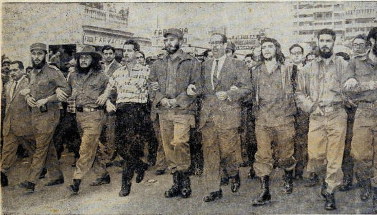
Fidel Castro y prominentes miembros de su Gobierno desfilan por las calles de La Habana en homenaje a los muertos por el sabotaje al barco "Le Coubre"

Aislamiento político, económico y acoso militar emplean yanquis contra Cuba